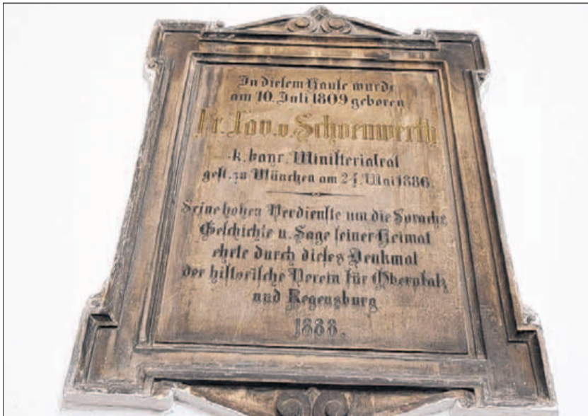
Diese Erinnerungstafel hängt im Gang neben der Eingangspforte der Decker-Schulen.

20. März, ab 19 Uhr: „Schönwerths Sagengelichter“ im Drahthammer Schlößl Amberg.