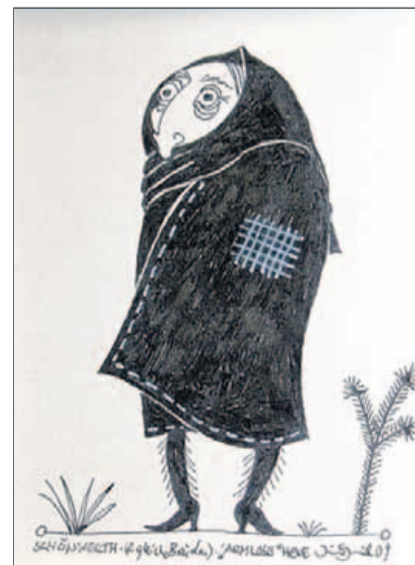
Die armlose Hexe aus „Zwei gleiche Brüder“.

18. Dezember, Amberger Adventsingeln mit vorweihnachtlichen Sagen gestalten.