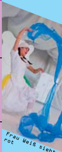
Frau Weiß sieht rot

INSZENIERUNG Kathrin Lehmann BÜHNE UND KOSTÜME Beate Diao MIT Maria Tietze